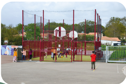
Un city park