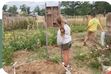
Un jardin pédagogique