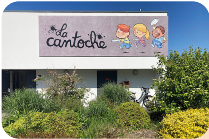
La cantoché, restaurant scolaire éco-responsable