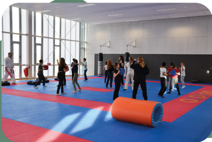
Des initiations sportives (Karaté, tennis, sports nautiques)