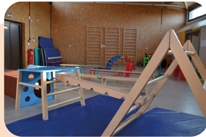
Un espace motricité de la maternelle