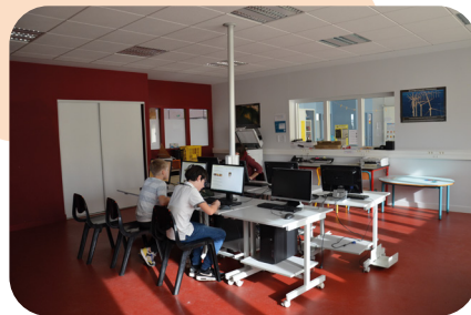
Une salle informatique