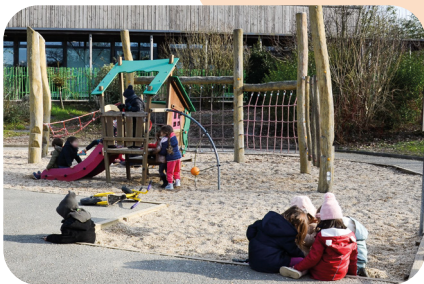
Cours de récréation des maternelles